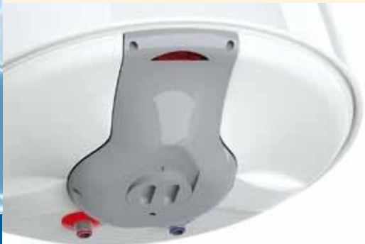
EXTERNAL TEMPERATURE REGULATOR REGULATEUR EXTERNE DE TEMPERATURE

Tous les chauffe-eau SUPER AQUAHOT sont fournis avec un câble d'alimentation électrique, des tuyaux flexibles pour l'eau chaude et froide et des tasseaux.